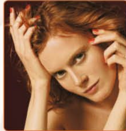
Laat de grote markt voor natuurlijke nagels niet aan je salon voorbijgaan.

ManiQ Color opent de weg naar de markt voor natuurlijke nagels op een ongekend makkelijke ('natuurlijke') manier. Wat denken jullie van al die dragers van zwakke nagels, die elke keer weer denken met een nieuwe nagelverstevinger "de" oplossing voor "het" probleem denken te hebben gevonden. En de beauty-bewuste vrouw die elke drie, vier dagen worstelt met nagels die moeten worden bijgelakt? Deze groep zag je tot nu toe weinig of niet in de salon, omdat deze klanten voornamelijk bezig zijn met de natuurlijke nagel. Met ManiQ Color kan iedere professional deze markt te bedienen.